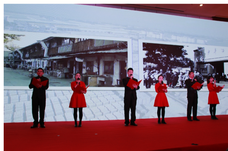
经典诵读《安得广厦千万间》