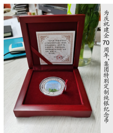
为庆祝建企70周年，集团特别定制纯银纪念币