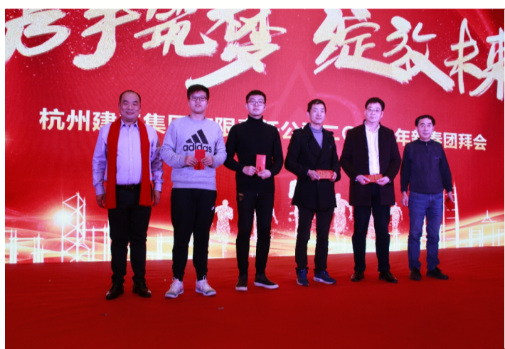
技术创新优秀代表颁奖