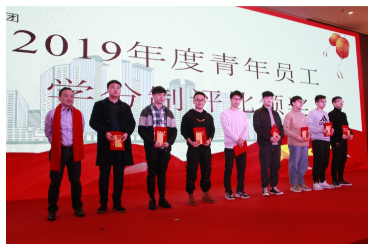
二零一九年度青年员工学分制评比颁奖

旧岁已展千重锦，新篇更待百倍增，蓝图已绘就，奋进正当时，号角已吹响！2020年，让我们继续携手，团结一致，砥砺前行新时代，同心谱写新篇章！（综合办 刘愈）